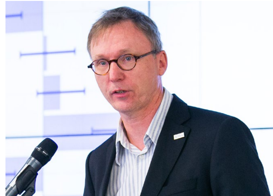
Vortragender: Prof. Dr. Ralf Reintjes

After eight elicitations with total sample of 1366 responses, a decreasing trend of smoking and increasing trend of cannabis consumption can be observed among Hamburg students. In comparison, Manchester students tend to smoke significantly more (OR = 3.74, 95%CI 1.95-7.17), but consume less cannabis (OR = 0.51, 95%CI 0.14-0.9). Trends in physical activity and healthy food consumption complete the overview. Focus groups revealed that SuSy is perceived as an appealing, useful and recognisable tool among students from both universities.