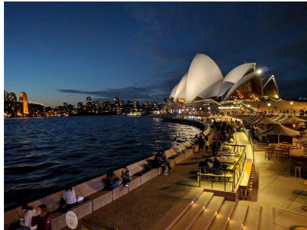
Opera House, Sydney

Neben der Bewerbung musste ich mich auch um einige andere Dinge kümmern. Um die Unterkunft, Flüge, Abholung vom Flughafen, Kurse, Impfungen und einiges mehr sollte man sich vorher Gedanken machen. Außerdem würde ich empfehlen sich eine Kreditkarte zu besorgen, mit der man weltweit kostenlos Geld abheben kann (z.B. von der DKB). Dadurch hätte ich theoretisch gar kein australisches Konto mehr gebraucht und man spart sich teure Gebühren und kommt auch in Notfällen an sein Geld.