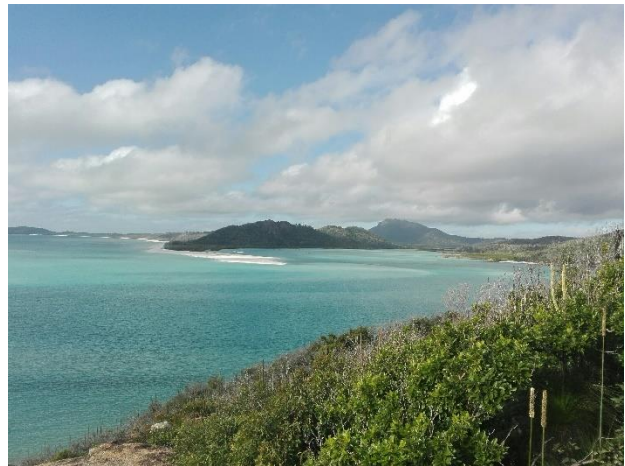
Whitsunday Islands, Westküste

Für mich war es ein großer Wunsch während und nach dem Semester durch das Land zu reisen und möglichst viel zu sehen. Durch den frühen Start des Semesters konnte ich nicht vorher reisen, aber während und nach dem Semester habe ich die Gelegenheit so oft wie möglich genutzt. Sehr hilfreich bei der Planung und Buchung ist das Reisebüro von statravel auf dem Campus. Von dort habe ich fast alles gebucht nachdem ich vorher online die Preise verglichen habe. Um Ostern herum hat man eine Woche frei, die ich dazu genutzt habe, um eine Tour mit „Groovy Grape“ entlang der Great Ocean Road von Adelaide nach Melbourne zu machen. Während des Semesters war ich ein Wochenende in Hawk's Nest mit dem Surfclub und am Seven Miles Beach für ein Surfwochenende unterwegs. Während der Einführungsveranstaltung für Austauschstudenten werden Gutscheine für das Wochenende am Seven Miles Beach verteilt. Dann kommen noch viele Tagestrips um und in Sydney dazu. Palm Beach, die Blue Mountains, Hunter Valley, den Bondi to