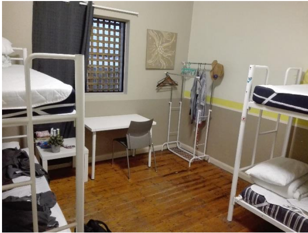
Unterkunft im Hostel