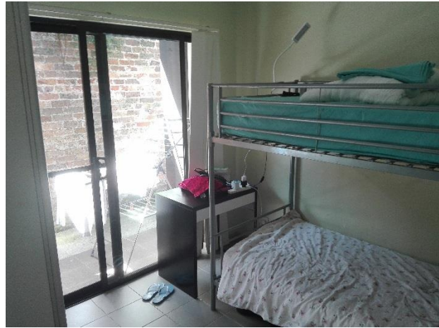
Zweier-Zimmer in Kensington