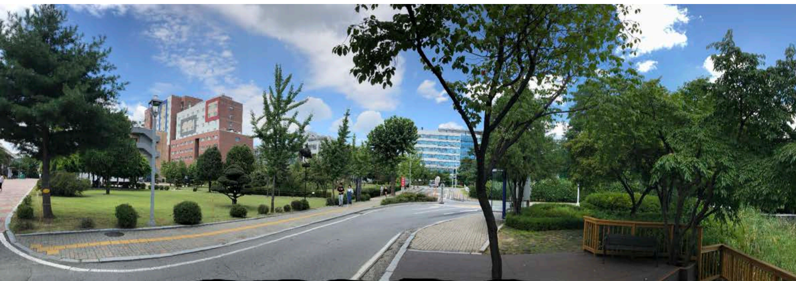
Ausblick auf den Campus der Seoul Tech