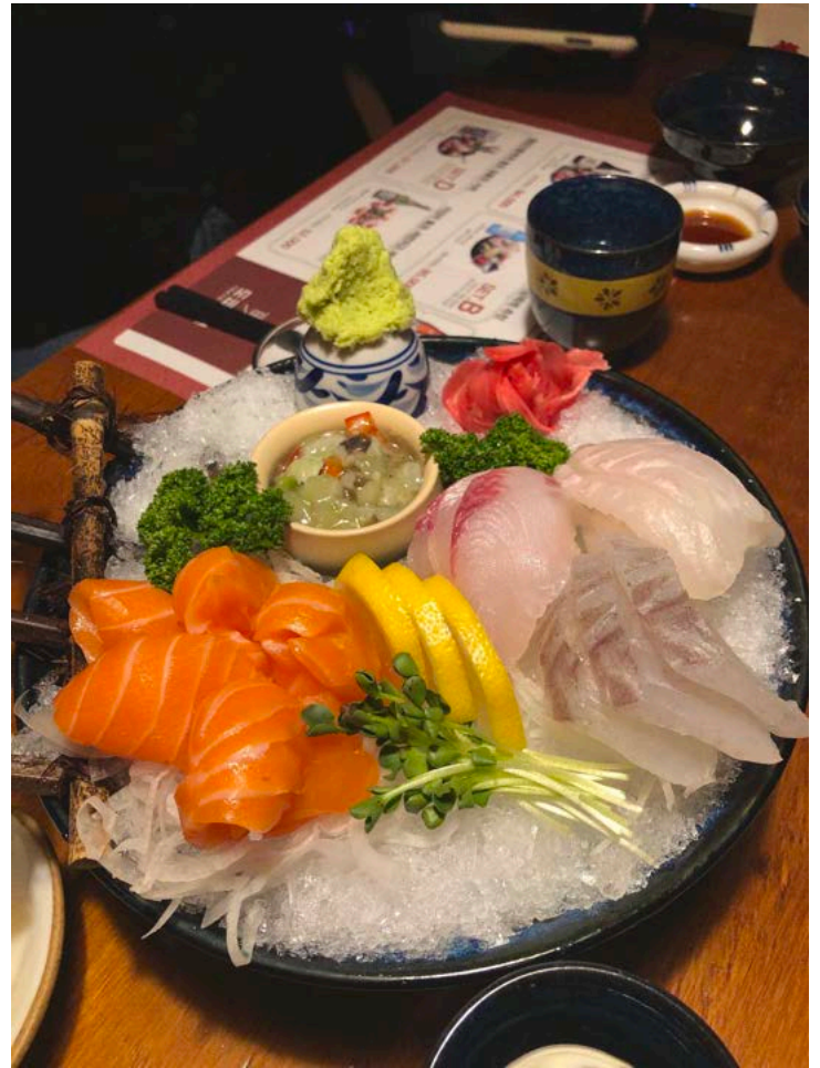
Frischer Fisch und Gemüse – das koreanische Essen empfehle ich sehr!

Einige meiner Kommilitonen wohnten auch in ‚Shared Houses‘ in der Stadt, eine Art Wohngemeinschaft in einem kompletten Haus.