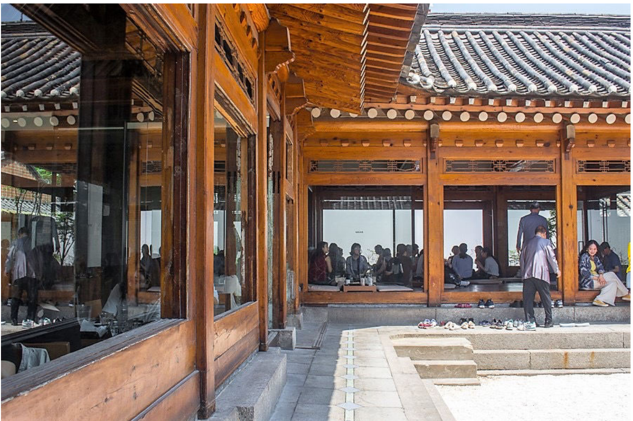
Café Onion, Anguk Station - bekannt für landestypische Speisen & Getränke