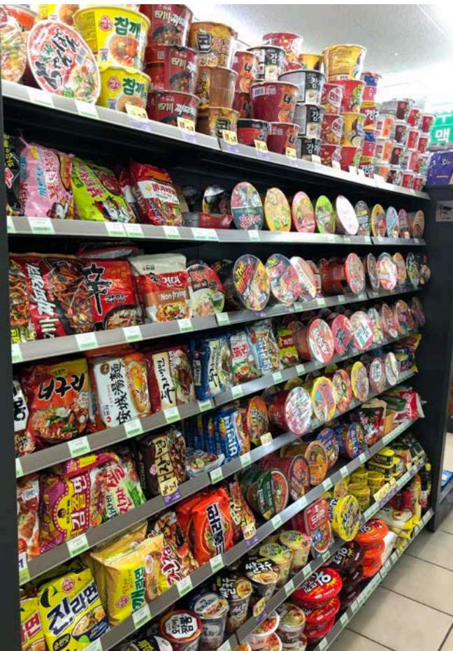
Nie muss man hungrig ins Bett gehen. Fußläufig ist immer ein gut ausgestatteter CU/711 in der Nähe, egal wo man ist