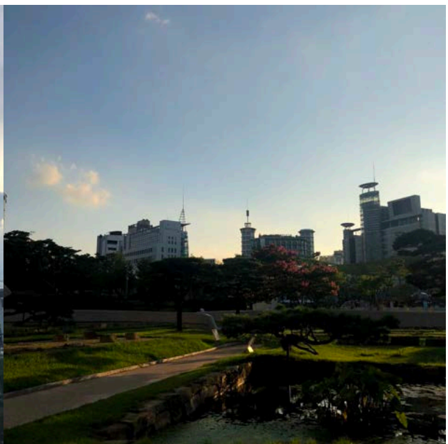
Dongdaemun History & Culture Park In einem Museum und Park (entworfen von Zaha Hadid) finden Ausstellungen und Events statt.