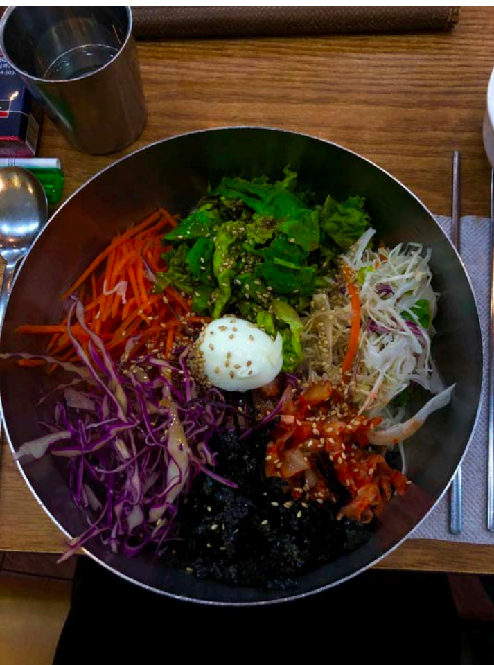
Koreanisches Nudelgericht mit frischem Gemüse