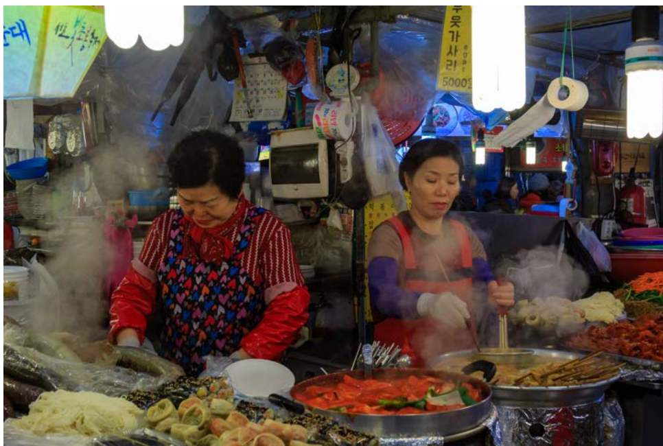
Gwangjang Market - Zu jeder Tageszeit kann man hier traditionelle koreanische Gerichte zu günstigen Preisen essen.

Oft bestiegen mein Gastbruder und ich den Berg und bewegten uns im kostenlosen Outdoor Fitnessstudio auf dem Gipfel des Berges. Hier begegnet man sehr vielen Wandernden, da es eine beliebte Wochenendbeschäftigung ist, in einer Gruppe von Menschen den Aufstieg auf den Gipfel zu wagen.