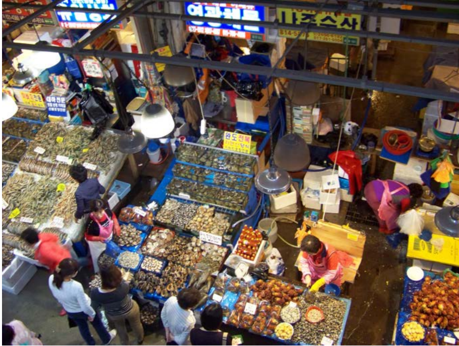
Noryangjin Fisheries Market – südwestlich des Han Flusses kaufen hier unzählige Menschen 24h am Tag frische Meeresfrüchte.

Essen gehen muss nicht teuer sein, nach oben hin sind hier jedoch kaum Grenzen gesetzt. Hier hilft es, wenn man einige Worte Koreanisch sprechen kann, da viele günstige Restaurants nur koreanische Speisekarten besitzen.