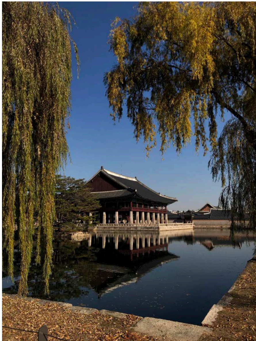
Teil des Gyeongbokgung Palastes (1395)