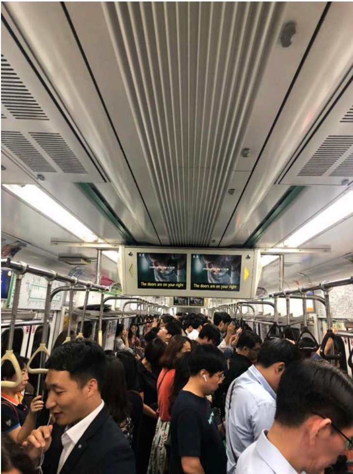
Selbst zur Rush Hour ist alles sehr organisiert und man kommt schnell von A nach B.

Dafür bin ich sehr dankbar! Auch wenn ich bestimmt gerne auf dem Campus gewohnt hätte, bin ich rückblickend sehr zufrieden mit meiner Entscheidung. Ich hätte auf dem Campus sehr wahrscheinlich mehr Zeit mit den International Students verbracht, als mit Koreanern z. B. das Herbstfest ‚Chuseok‘ Anfang Oktober zu feiern.