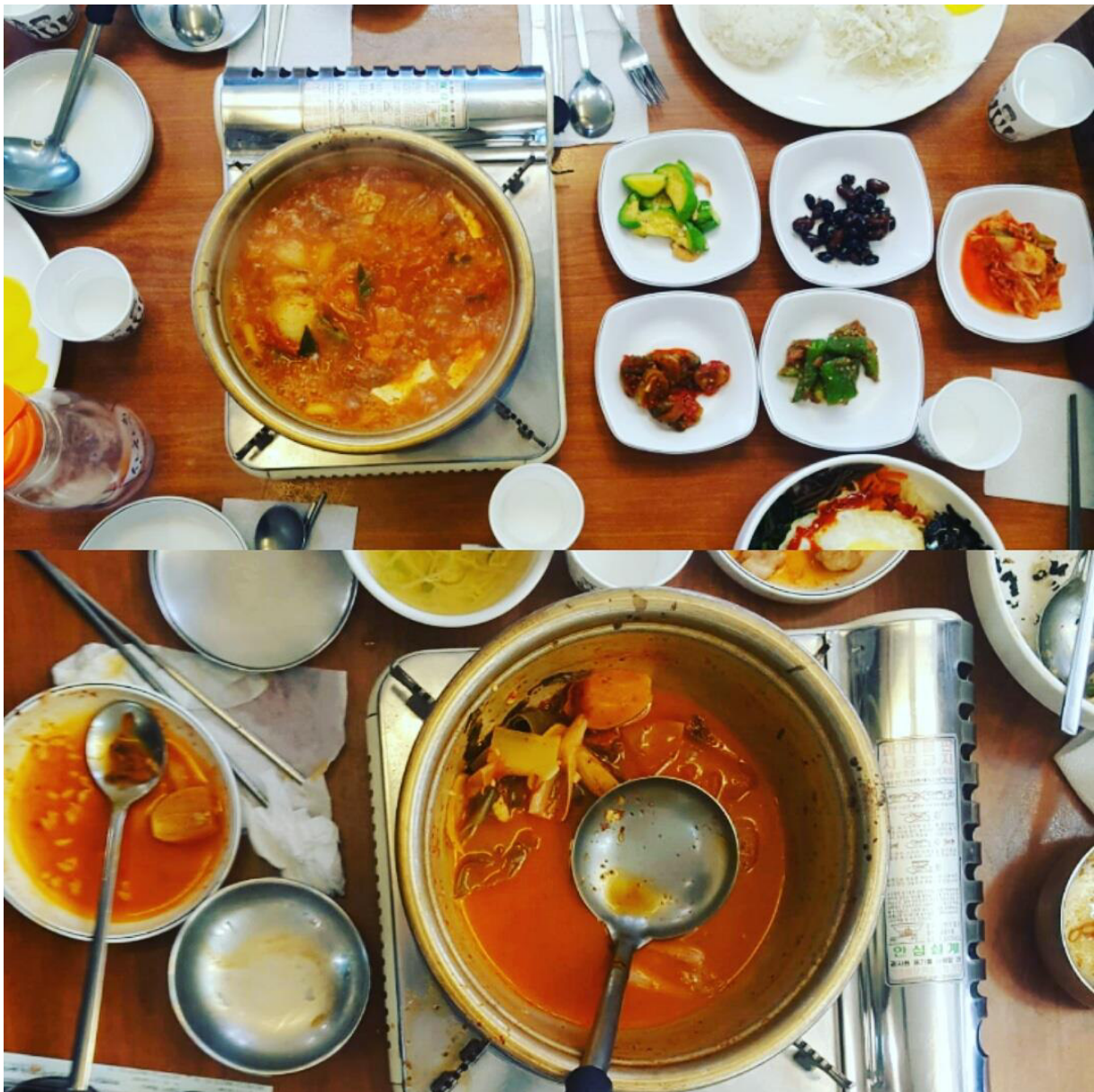
Kimchi-Eintopf, vor- und nach dem Essen. Koreanisches Essen ist oft sehr scharf. Ich liebe die Koreanische Küche.