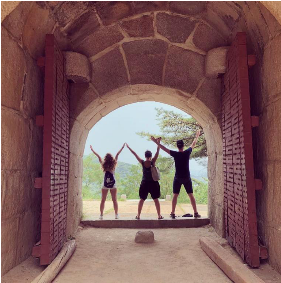
Wandern am Wochenende an der alten Stadtmauer von Seoul auf dem sog. Bugaksan-Trail