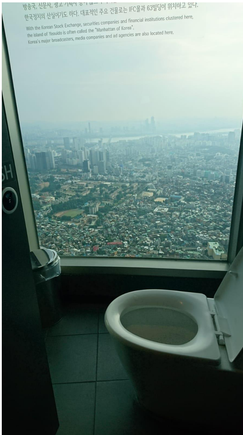
Lustige Kuriosität: Ausblick von der Toilette des Namsan-Tower. Dieser Fernsehturm steht auf dem Namsan-Berg und erlaubt einen wunderschönen Blick über Seoul.