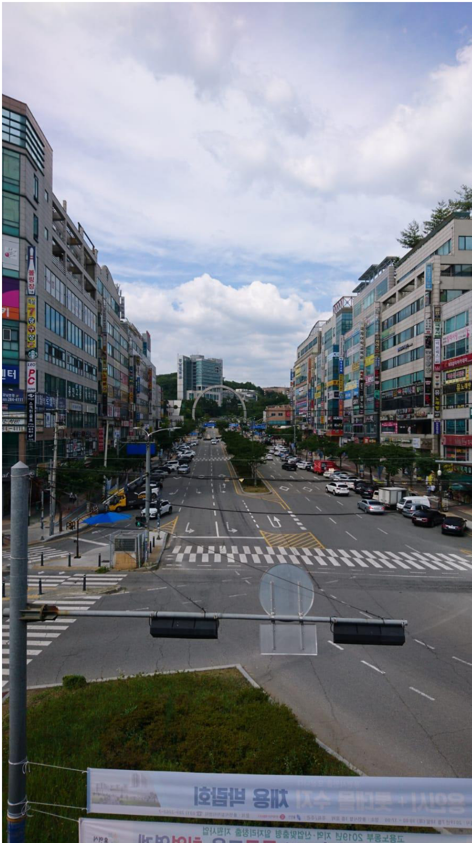
Die Straße vor der Universität. Hier gibt es alles zu kaufen was man braucht. Man kann gut essen gehen und auch Karaoke nach koreanischer Art singen. Busse und Bahn fahren in alle Richtungen. Der große Steinbogen im Hintergrund wird von den Student_innen der Kangnam University zum Spaß "The Hairband" genannt und markiert den eingang des Uni-Geländes. Das große Gebäude dahinter ist das Hauptgebäude und nennt sich "Shalom".