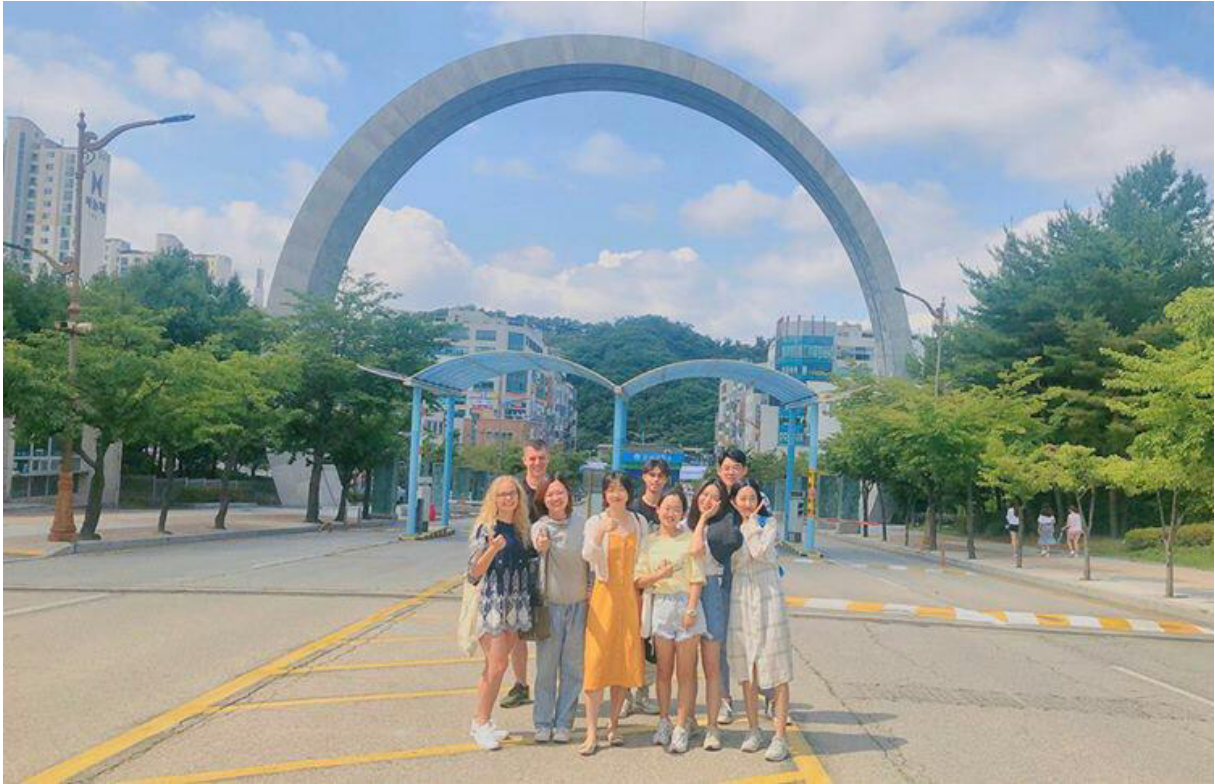
Gruppenfoto vor dem "Hairband" mit einem Teil meiner Koreanischklasse.