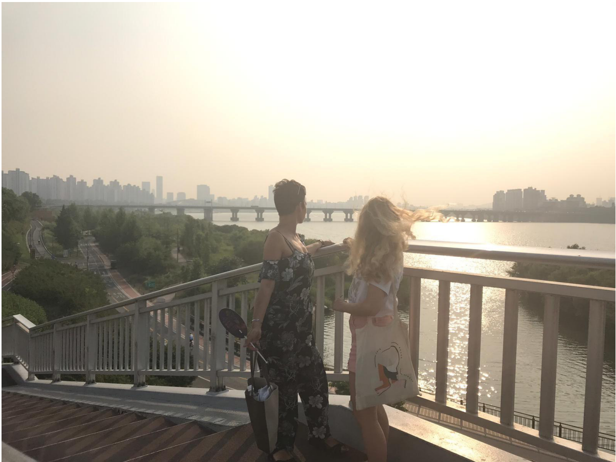
Abendstimmung am Han-River. Nach dem Unterricht lässt sich hier die Zeit sehr schön verbringen.