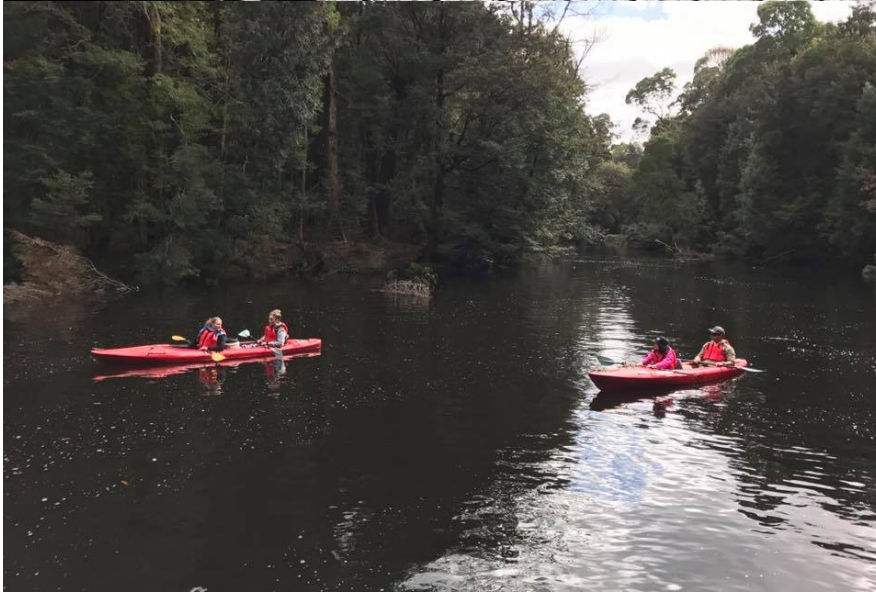
Tasmanien: Wombat Pool in Cradle Mountain, Bay of fires und Kayaking in Corinna