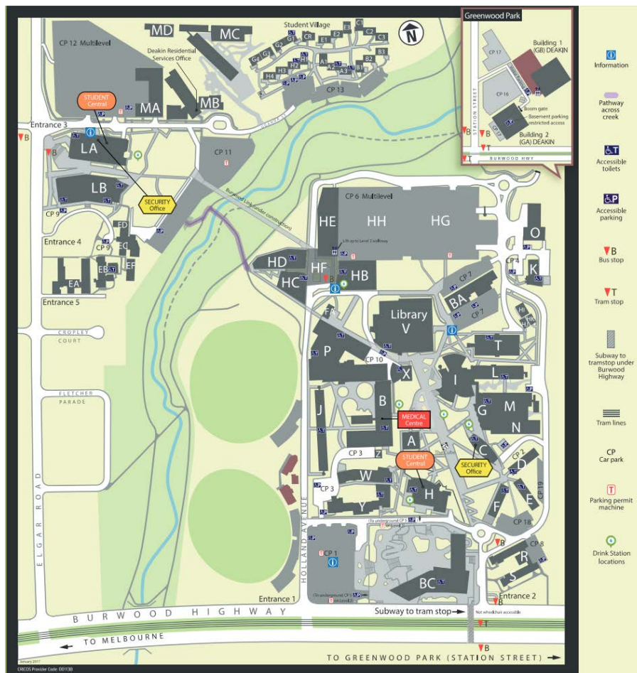
Karte vom Burwood Campus

Auch ein Fitnessstudio befindet sich auf dem Burwood Campus, welches neben den Cardio- und Kraftgeräten auch einige Fitnesskurse anbietet. Wer sich in einem Mannschaftssport probieren möchte, kann dies in einem der vielen Clubs der Student Association machen.