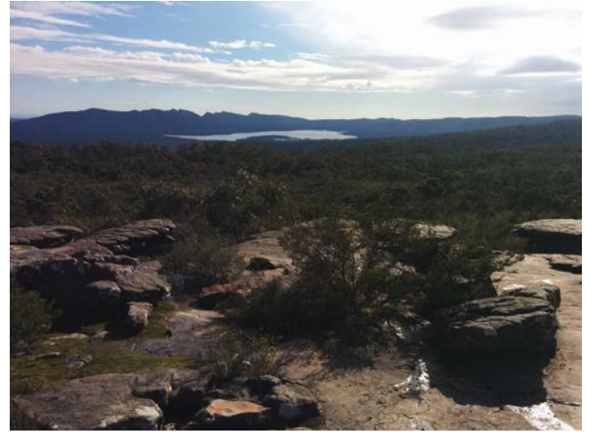
Wandern in den Grampians

Während des Semester hatten wir eine Woche Osterferien. Während einige Kommilitonen versuchten in einer Woche ganz Neuseeland zu bereisen, entschied ich mich dafür nach Tasmanien zu fliegen. Wer an Natur und Wandern interessiert ist, sollte die ‚Insel vor der Insel‘ unbedingt besuchen!