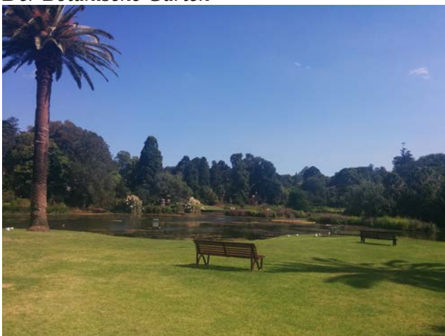
Der Botanische Garten