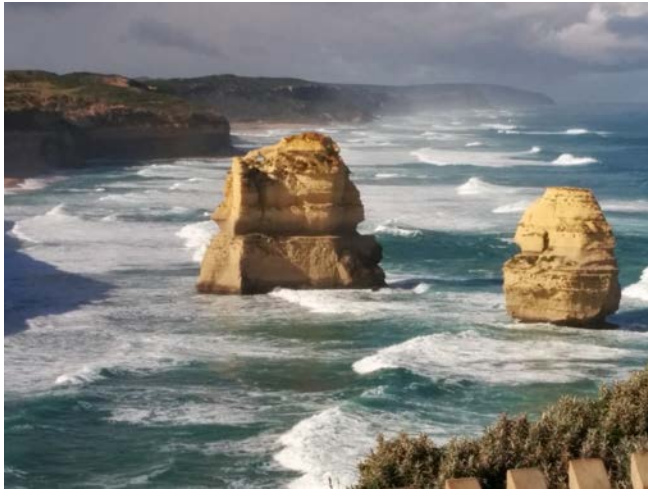
12 Apostles (Great Ocean Road)