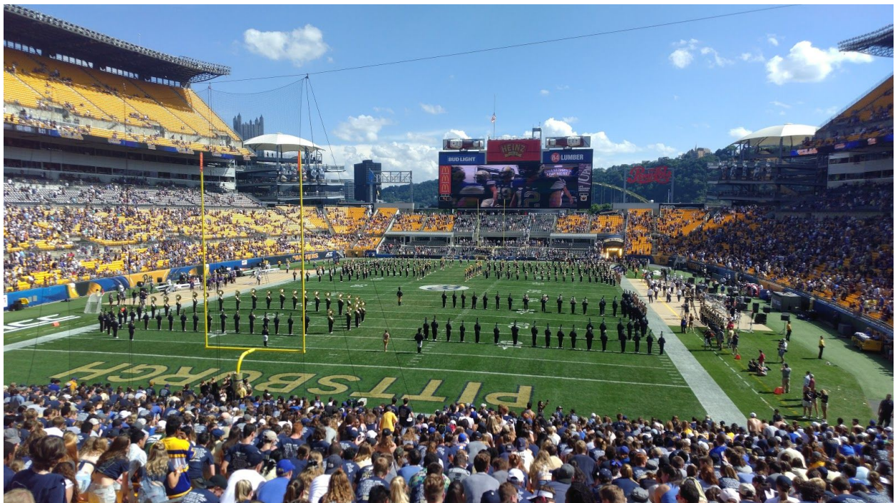
(Pitt Varsity Marching Band vor Spielbeginn)

Ein weiteres Highlight während des Semesters waren außerdem die Spiele der Uni-Football-Mannschaft, den Pitt Panthers. Da diese im selben Stadion wie auch die NFL-Spiele stattfinden, existiert ein Shuttleservice, der die Studenten in den berühmten, amerikanischen, gelben Schulbussen vom Campus in Oakland zum Stadion und wieder zurück bringt. Diese werden während der gesamten Saison zahlreich besucht und die Atmosphäre im Stadion (vor allem bei gutem Wetter und gutem Spielstand) ist unbeschreiblich und vermittelt einem ein Gefühl der Zugehörigkeit. Dies gilt auch für die Spiele der Basketball-Mannschaft Oakland Zoo, deren Heimspiele in der letzten Hälfte des Wintersemesters im Peterson Event Center und damit in unmittelbarer Nähe zum Campus ausgetragen werden.