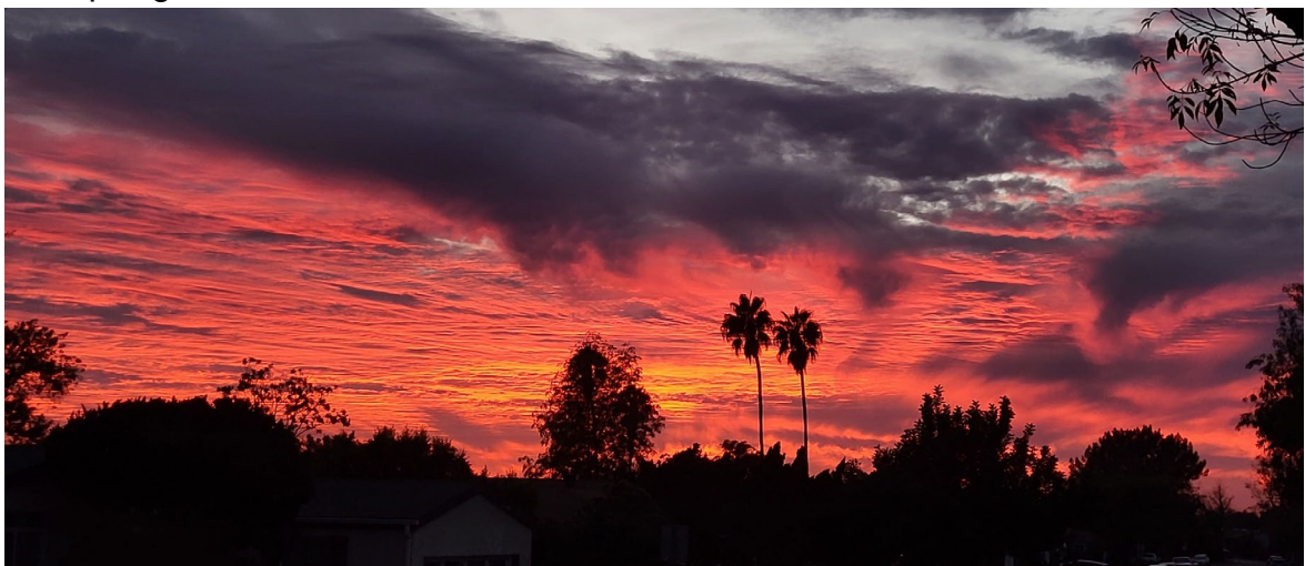
Sonnenuntergang vor meiner Haustür