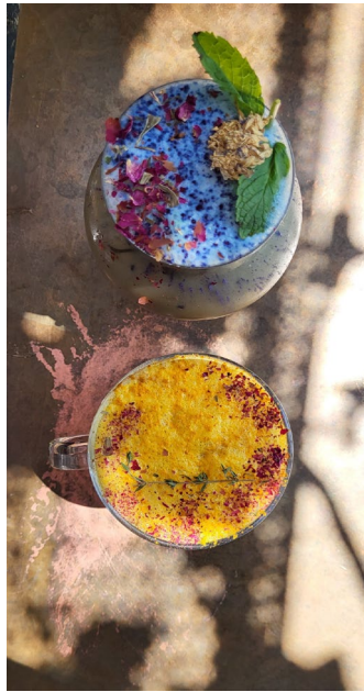
Lattes im Cafe 21 University Heights