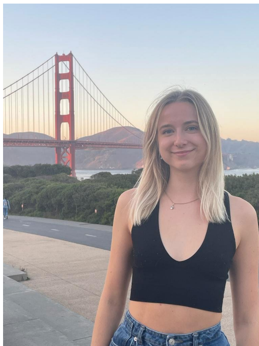
Golden Gate Bridge, San Francisco