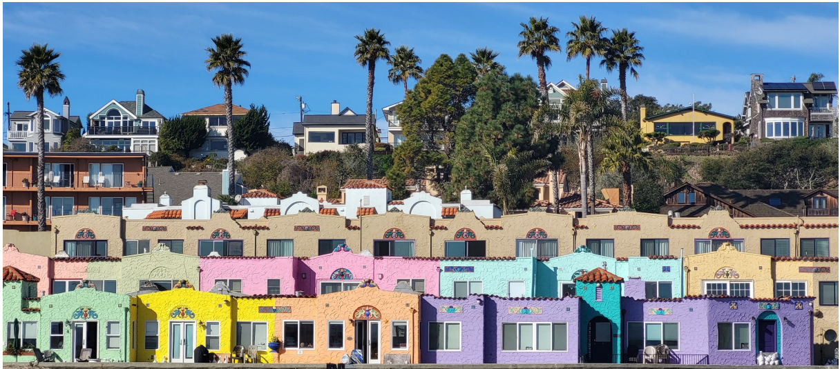
Bunte Häuser in Capitola, Kalifornien