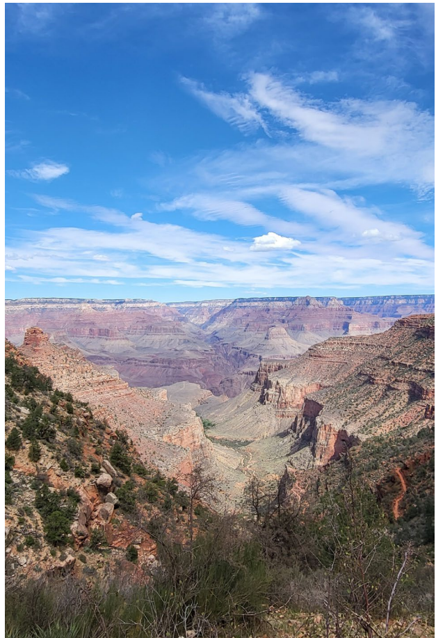
Grand Canyon, Arizona