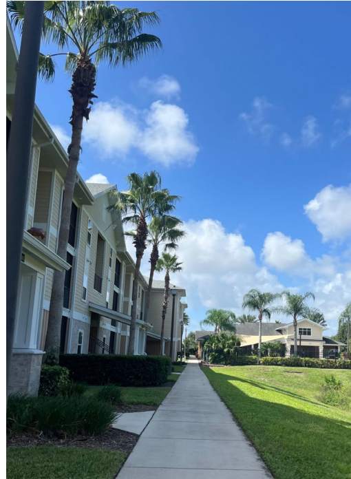
Die Apartment Buildings