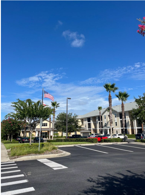
Das Eagle Landing Clubhaus

Hier sind ein paar Eindrücke über Eagle Landing: