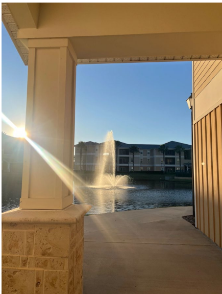
Der See inmitten der Gebäude