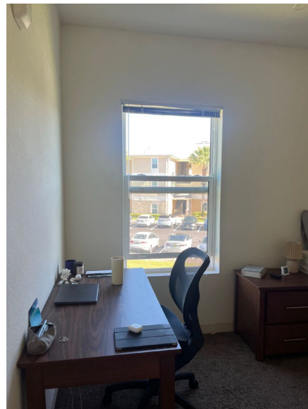
Mein Dorm Room