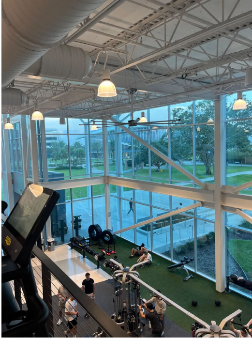
Das Gym auf dem Campus