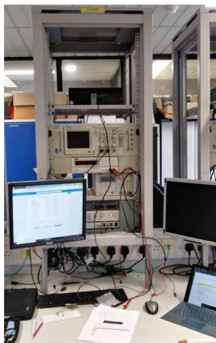
Abbildung 1: Das ist eine typische Arbeitsstation im Labor

Fast alle Labore waren in Individualleistung zu bearbeiten, also nicht in Gruppen. Zudem war es dozentenabhängig, ob jede Woche ein Bericht geschrieben werden musste oder ein langer am Ende des Semesters. Diese Berichte wurden bewertet und gingen auch zu großen Teilen in die Endnote ein.