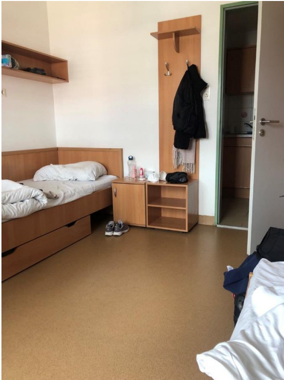
Ich habe mich schnell daran gewöhnt das Zimmer zu teilen.