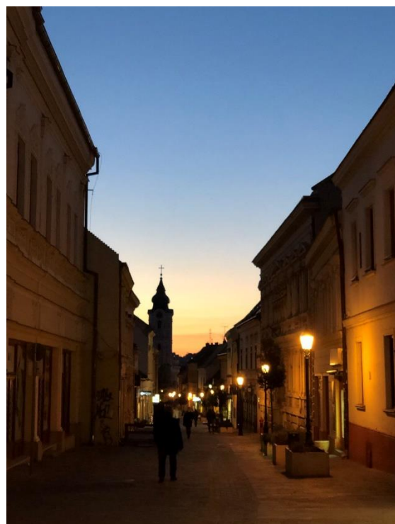
Von l. nach r.: Beeindruckende Architektur auf dem Kunstcampus, Budapest von der Buda Seite kurz nach Sonnenuntergang während eines Solo-Trips, nach dem Lernen auf dem Heimweg und die ersten Anzeichen von Sommer in Pécs.