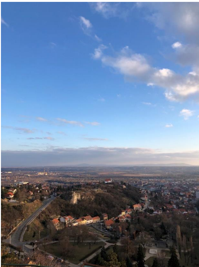
Ausblick auf Pécs von oben, aufgenommen vom Tettye Hügel.