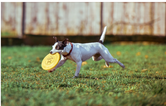
Automatische Bildinterpretation durch KI-Software NeuralTalk2, basierend auf rekurrenten neuronalen Netzen (Bild Public Domain): „A dog is running in the grass with a frisbee“

Die Veranstaltung richtet sich an Studenten aller Bachelor-Studiengänge der Informatik und hat einen Umfang von 6 SWS. Wenn Sie Fragen zum Projekt haben, sprechen Sie mich gerne an. Ich stelle auch gern einen Kontakt zur aktuellen Gruppe her.