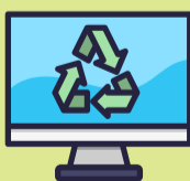
Elektro- & Elektronikgeräte