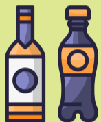
Glas- & Plastikflaschen